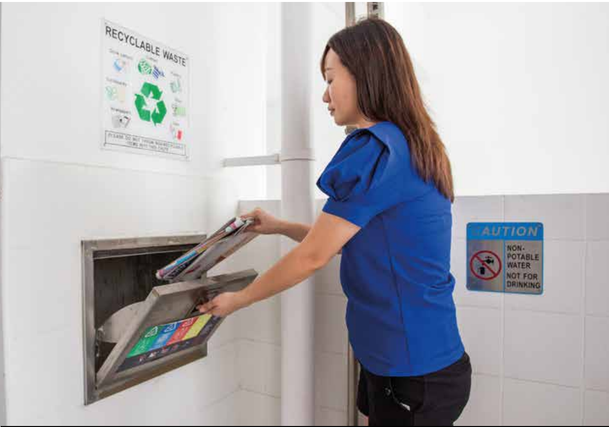
Separate chutes for recyclable waste

To encourage a “green” lifestyle, Teck Whye Vista is designed with several eco-friendly features which include separate chutes for recyclable waste, eco-pedestals in bathrooms to encourage water conservation and bicycle stands to promote cycling as an environmentally friendly form of transport.