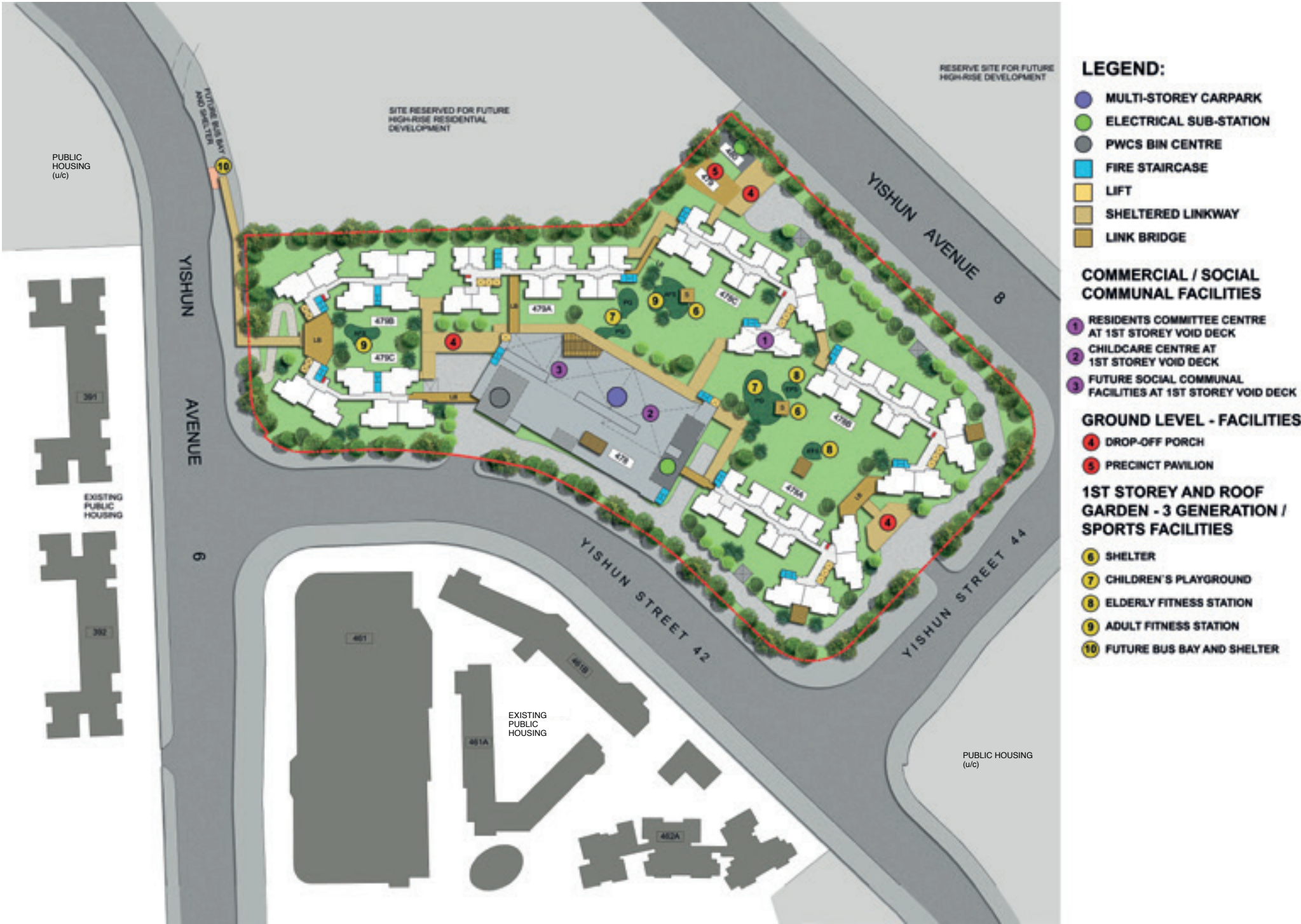
Site plan for Valley Spring @ Yishun

Valley Spring @ Yishun -இல் 2-அறை ஃப்ளெக்ஸி, 3- மற்றும் 4-அறை வீடுகள் என 824 வீடுகளை உள்ளடக்கிய ஆறு குடியிருப்புத் தொகுதிகள் உள்ளன.