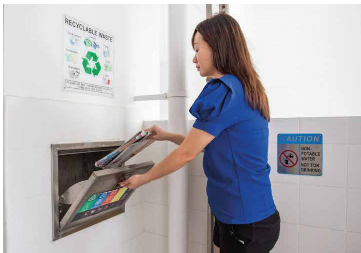
Separate chutes for recyclable waste

To encourage an eco-friendly lifestyle, the development is designed with several eco-friendly features. This include separate chutes for recyclable wastes, eco-pedestals in bathrooms to encourage water conservation and bicycle stands to encourage cycling as an environmentally friendly form of transport. In addition, the precinct also comes with a Pneumatic Waste Conveyance System to provide cleaner waste disposal.