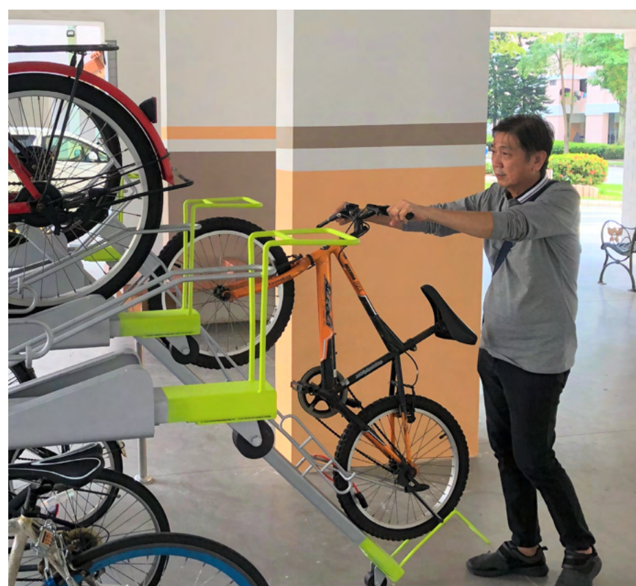
Bicycle stands to encourage cycling