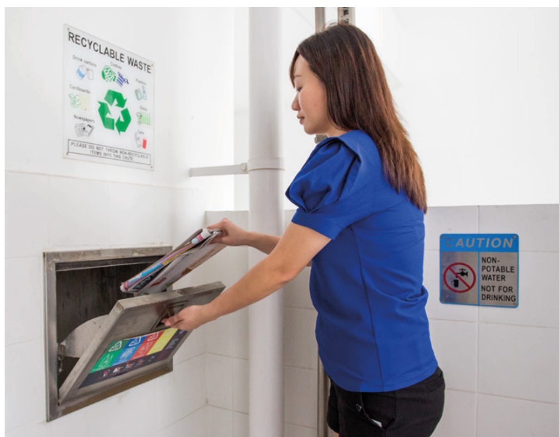
Separate chutes for recyclable waste

To encourage a 'greener' and sustainable lifestyle, Sun Sails is designed with several eco-friendly and smart features. These include separate chutes for recyclable waste; regenerative lifts and smart lighting in common areas to reduce energy consumption; bicycle stands to encourage cycling as an environmentally friendly form of transport; parking spaces to facilitate future provision of EV charging; and Active, Beautiful, Clean Waters design features to clear rainwater and beautify the landscapes.