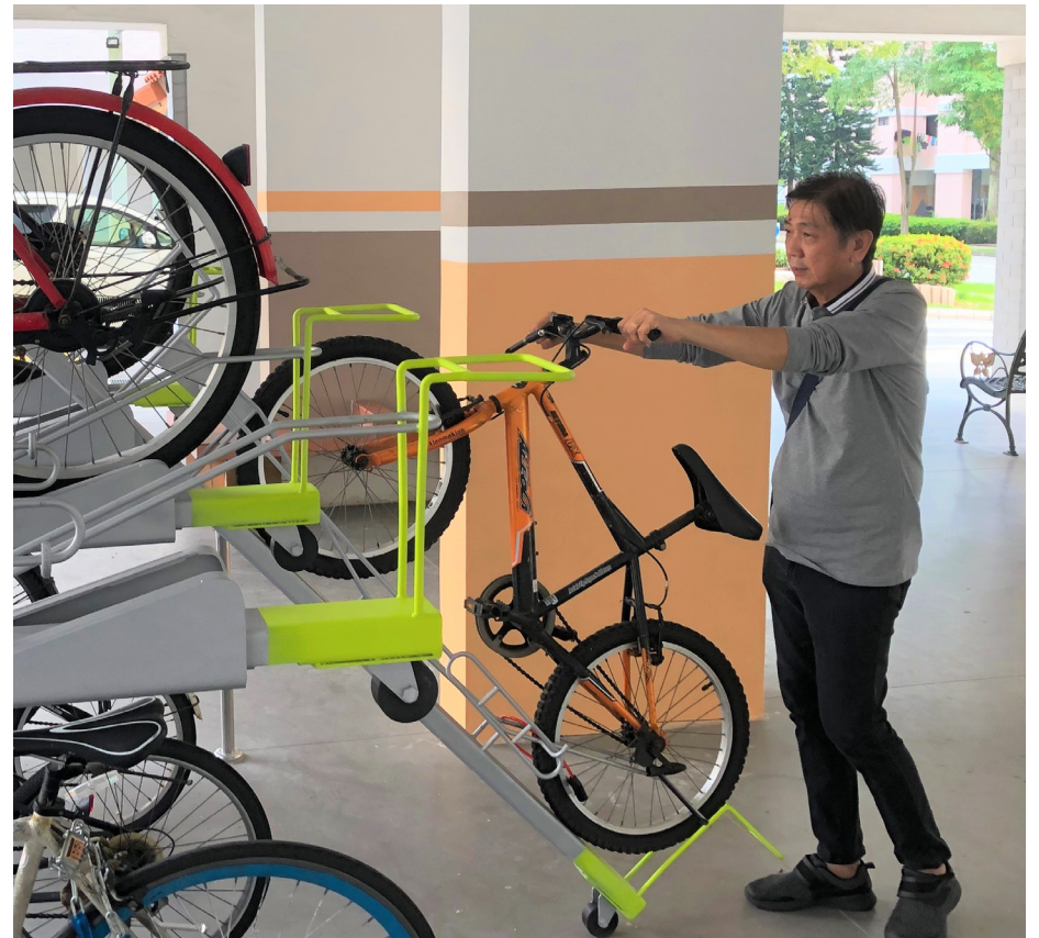
Bicycle stands to encourage cycling