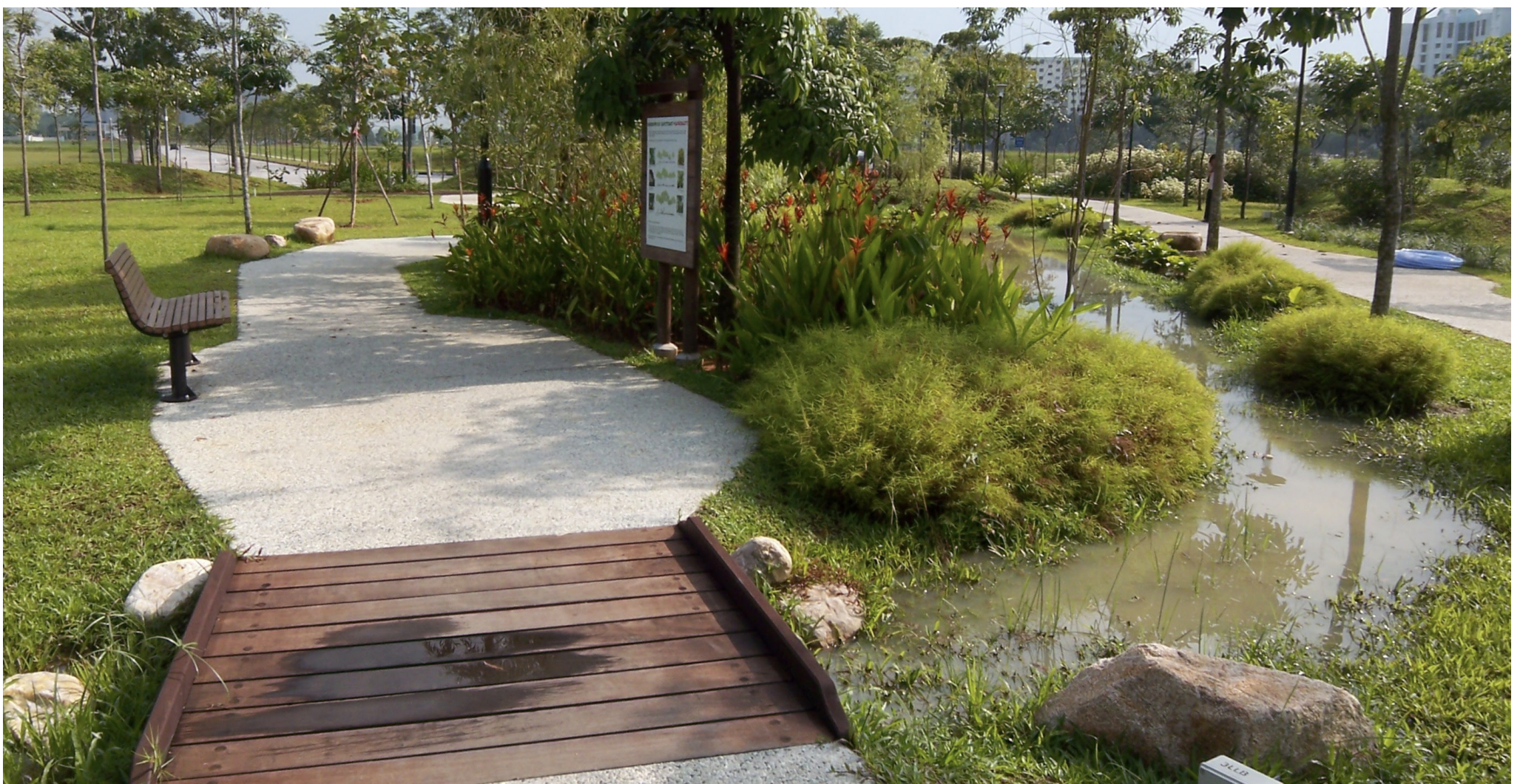
ABC Waters design features

© 2023 Housing & Development Board. All rights reserved.