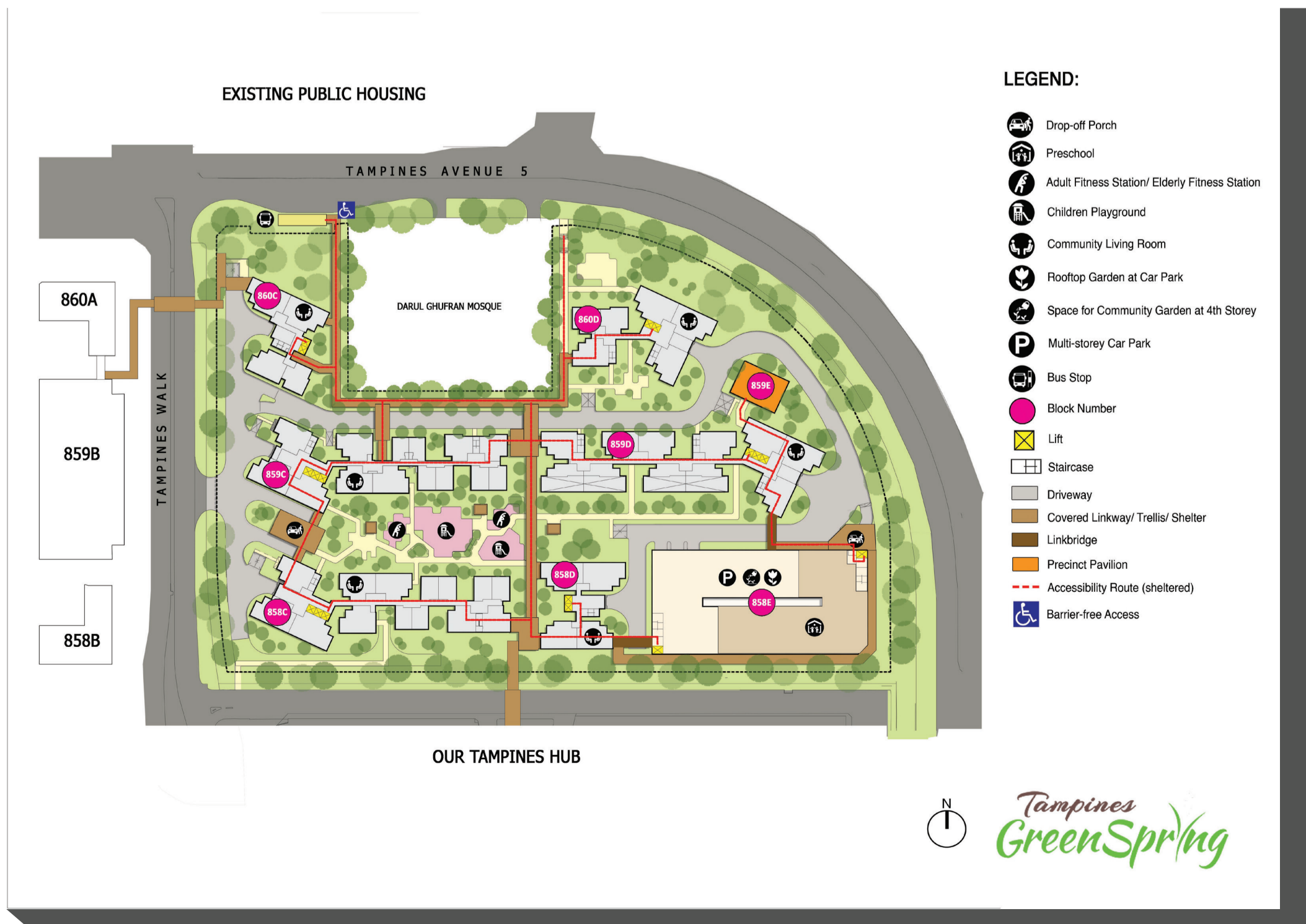
Site plan for Tampines GreenSpring

இதன் குடியிருப்பாளர்கள் இக்குடியிருப்புப் பேட்டையின் நடுவே வளம் ததும்பும் பசுமையையும், மேற்கூரை தோட்டங்களையும் ஆங்காங்கே உள்ள சிறு சிறு தோட்டங்களையும் கண்டும் பயன்படுத்தியும் மகிழலாம். சிறுவர்களோ அங்குள்ள கருப்பொருள் சார்ந்த விளையாட்டு திடலில் விளையாடி மகிழலாம். இவ்விளையாட்டுத் திடலின் கருப்பொருள், 1990-களில் இருந்த தெம்பனீஸ் மணல் சுரங்கப் பண்பாட்டை பிரதிபலிக்கின்றது. குடியிருப்பாளர்களின் வசதிக்காக இரு அடுக்குமாடிக் கார் நிறுத்தங்கள் அமைக்கப்பட்டுள்ளன. அதில் ஒன்று குடியிருப்புப் பேட்டைக்குள்ளேயே இருக்கும் மற்றொன்று தெம்பனீஸ் வாக்கிற்கு எதிர்புறம் உள்ள புளோக் 859B-ல் அமைந்திருக்கும்.