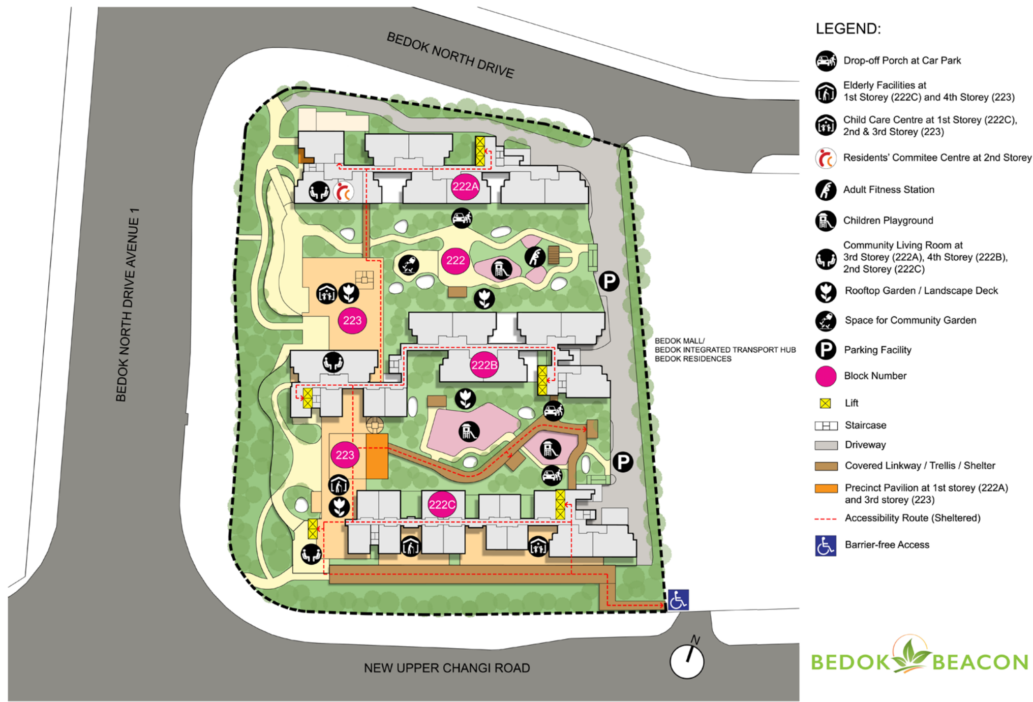
Site plan for Bedok Beacon

பிடோக் நார்த் டிரைவ், பெடோக் நார்த் அவென்யூ 1 மற்றும் புதிய அப்பர் சாங்கி சாலை ஆகியவை சூழ அமைந்துள்ள Bedok Beacon மூன்று குடியிருப்புத் தொகுதிகளைக் கொண்டுள்ளது, இதில் 2-அறைகள் ஃப்ளெக்ஸி மற்றும் 4-அறைகள் கொண்ட 500 வீடுகள் உள்ளன. Bedok Beacon என்ற பெயர் பிடோக் டவுன் சென்டர் அனைத்து வசதிகளுடன் வளர்ச்சியடைந்த அருகாமையுடன் அமைந்துள்ளதை வெளிப்படுத்துகிறது. பிடோக் நார்த் டிரைவ், பெடோக் நார்த் அவென்யூ 1 மற்றும் புதிய அப்பர் சாங்கி சாலை ஆகியவை சூழ அமைந்துள்ள Bedok Beacon மூன்று குடியிருப்புத் தொகுதிகளைக் கொண்டுள்ளது, இதில் 2-அறைகள் ஃப்ளெக்ஸி மற்றும் 4-அறைகள் கொண்ட 500 வீடுகள் உள்ளன. Bedok Beacon என்ற பெயர் பிடோக் டவுன் சென்டர் அனைத்து வசதிகளுடன் வளர்ச்சியடைந்த அருகாமையுடன் அமைந்துள்ளதை வெளிப்படுத்துகிறது.